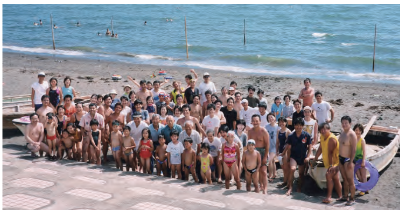
事前準備時の集合写真(平成13年)

平成11(1999)年からは、6月・7月の土曜日午後学習院生涯学習センター主催で行っている初等科6年生対象の泳法教室も始まり、主に沼津游泳訓練に向けた隊列游、立游、横游ぎ、飛び込み等の游