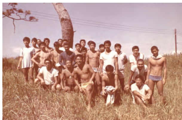
沼津游泳会発足前年の助手達(昭和42年)

そのように年々変化して行く游泳訓練環境・状況に対応すべく、昭和43年に当時の大学生有志が集まり、学校側への安定的な助手の確保協力、助手としての泳力・技術力・指導力の向上を目指し、任意団