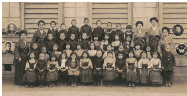
二葉保育園所蔵 学習院女子部幼稚園保育満了児 (大正6年)