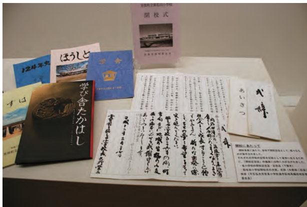
学校資料の展示風景－閉校式の式辞と閉校記念の刊行物－

芳賀町では、1997年度から2005年度にかけて、明治期開校の流れを汲む小学校9校の統廃合が漸次進められ、最終的に3校となった。それと期を同じくして、芳賀町史編さん事業、情報館の開館準備が行われてきた。その過程で、担当者が学校資料の散逸防止と将来的な活用を想定して、学校資料を収集してきた。その後、情報館開館後に資料の整理、評価選別作業を行った。そして、2014年夏、9校の歴史を写真や文書で紹介する企画展「わが町学校のあゆみ－小学校編－」を開催し、観覧した住民の方が学校写真の