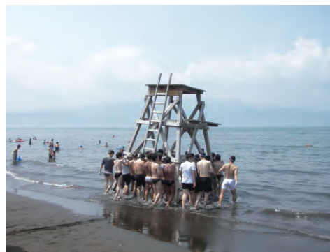
事前準備作業風景

また、各科とも6泊7日であった行事期間も、順次4泊5日へと短縮され、游泳行事期間内に更に効率良く・安全に過ごす事の重要性が増してきました。その他、游泳訓練の助手としての手伝いをする傍ら、行事の期間中に台風が接近した折には、和船の引き上げ固定作業や脚立の倒壊防止作業を行い、また脚立・杭・ブイ等が流された際には、復旧作業を速やかに行うなど、昼夜を問わず関わって参りました。