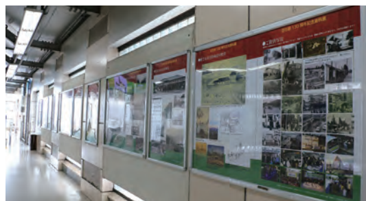
目白駅構内での展示風景