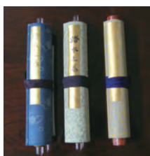
左から「腰水の巻」・「踏水の巻」・「目録」

なお、学習院と日本泳法小堀流踏水術の関係につきましては、また別の機会がありましたらその折に述べさせていただきます。