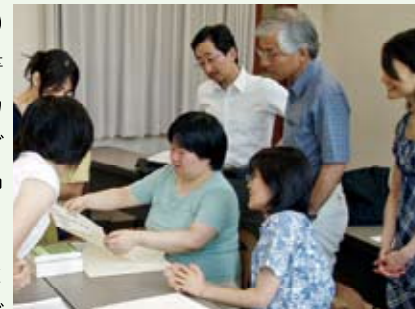
「アーカイブズ実習」の授業風景

たとえば理論と実践の調和という面では、博士前期課程の学生に、アーカイブズ機関での実習を1,2年次各2週間義務づけるなど、実務の現場に接する機会を多くするように工夫しています。2009