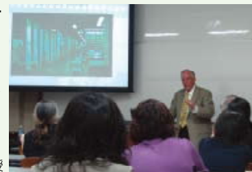
グレイシー教授による特別講義の様子

2007.11 ブルーノ・デルマ教授(エコール・デ・シャルト) 2008.10 デビッド・グレイシー教授(テキサス大学) 2009.1～ 菊池光興本学客員教授(国立公文書館前館長、特別相談役) 2009.10 エリック・ケテラール教授(アムステルダム大学)