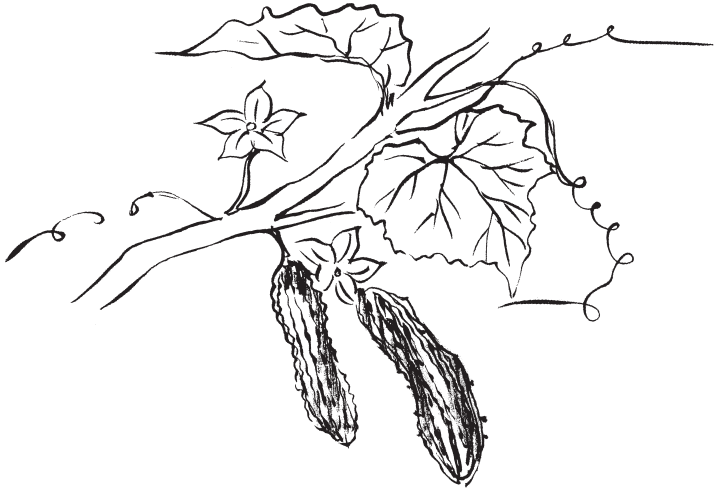
〔그림 32〕 071 o-i