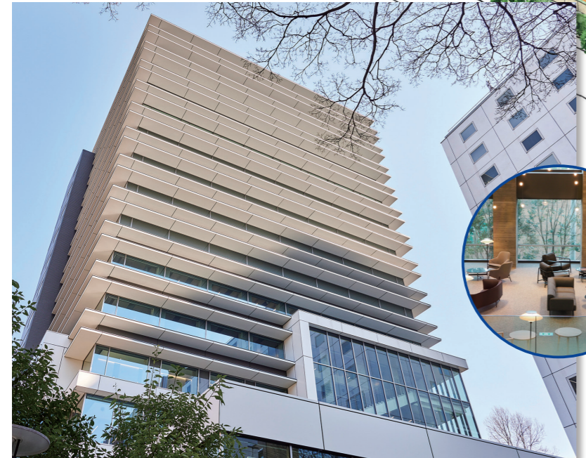
21 東1号館（令和5年4月開館） 令和5年春に誕生の新図書館（2階から11階）。次の時代を創る学生、研究者、すべての利用者の知的活動を支えます。