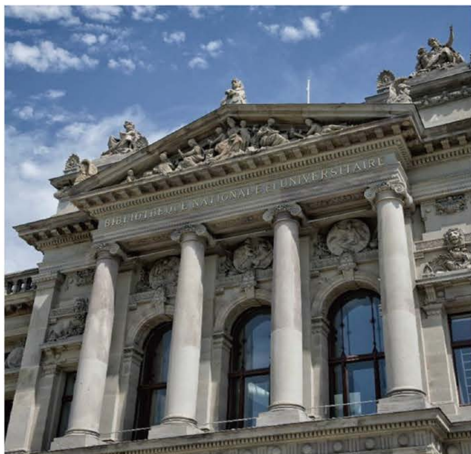
Bibliothèque nationale et universitaire

La Bnu propose, dans le prolongement de l'exposition, un parcours sur le théâtre japonais tel qu'il est représenté dans les estampes traditionnelles, en puisant dans les collections du Centre européen d'études japonaises d'Alsace (CEEJA) et du Cabinet des estampes et des dessins des Musées de Strasbourg. Ce parcours est inscrit au programme des Rencontres de l'Illustration 2018. Concerts et projections complètent la programmation. Bon festival !