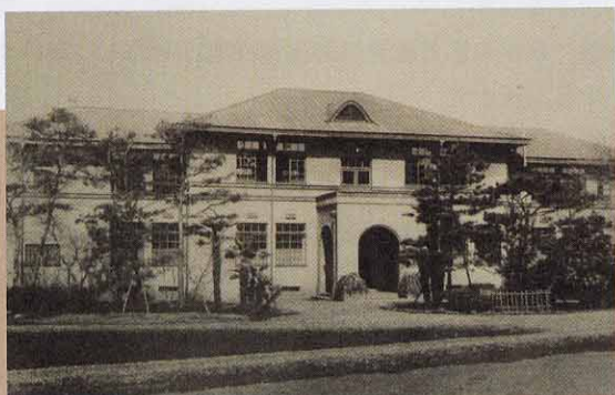
● 滝乃川学園本館(国登録有形文化財) 1932年竣工(現在修復中)