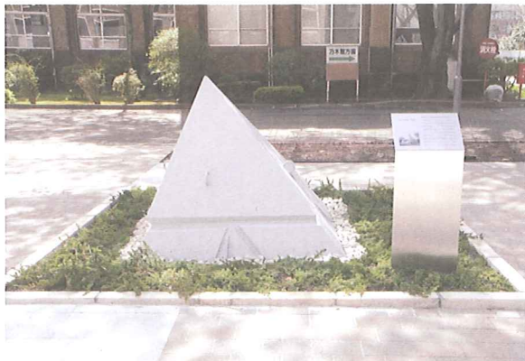
南1号館北側にモニュメントとしておかれた 中央教室(ピラミッド校舎)頂部

ミュージアム・レター第8号で解体の様子を特集したピラミッド校舎の頂部が新中央教育研究棟前の広場に設置されました。枝垂れ桜の下で、これからも学習院の歴史を見守り続けてくれることでしょう。