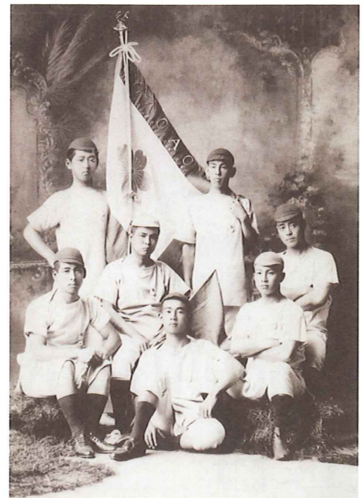
明治34年(1901)春季漕漕会優勝チーム 前列中央が志賀直哉