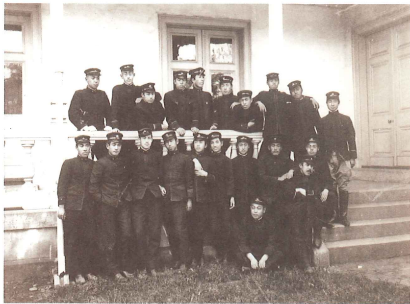
高等学科卒業前の記念写真・明治39年(1906)5月 前列左から2人目より志賀直哉、細川護立、木下利玄。前列右端が武者小路実篤