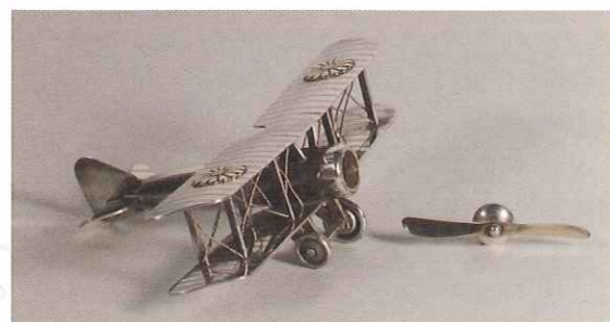
複葉機形ボンボニエール(6.8×9.2×2.6cm)