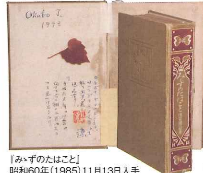
『みづのたはこと』昭和60年(1985)11月13日入手 カエデの葉がはさまれていた