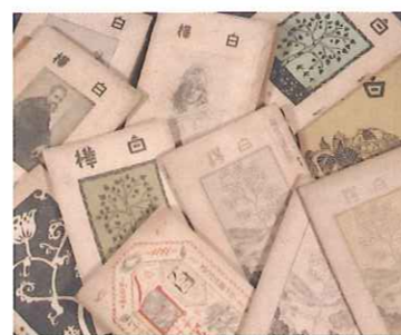
『白樺』創刊号(1910年4月)から大正期にかけてのもの