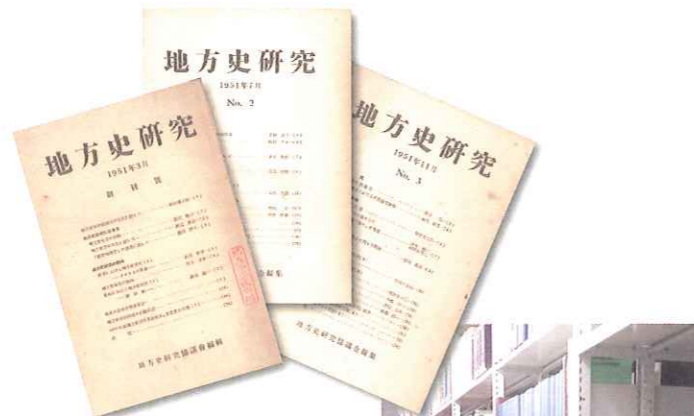
『地方史研究』創刊号~3号 (1951年3月~11月)

た蔵書のうち地方史関係図書は8千冊以上にのぼる。逐次刊行物の中には、氏が発足に関わった地方史研究協議会の会報『地方史研究』が創刊号から、史学会発行の『史学雑誌』も明治43年(1910)以降に発行された号が揃っている。歴史研究の基本文献が網羅されているだけでなく、『アララギ』や『中央公論』といった文学関係の雑誌も多く含まれている。さらに自身の著作である『近世農民生活史』(1957年 吉川弘文館)、『近世交通史の研究』(1986年 筑摩書房)をはじめ、執筆や編纂に携わった中学・高校歴史教科書やくずし字解読には欠かせないロングセラー『くずし字用例辞典』(1980年 近藤出版社)などが含まれる。歴史学に興味を持つ多くの学生や研究者の様々な問題、関心に応えてくれる充実した文庫である。