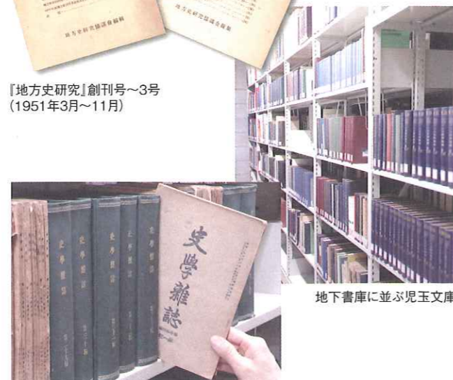
地下書庫に並ぶ児玉文庫