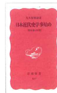
『日本近代史学事始め』亡くなる3日前に校了となった最後の著書