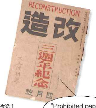
『改造』(1921年4月1日号) "Prohibited paper"と書きこみがある

大久保氏最後の著書『日本近代史学事始め』(1996年 岩波書店)は、原資料を追求した先駆的研究に加え、若き日に接した研究者との出会いや、多感な頃に読んだ本、古本屋との付き合いなど興味深い回想が綴られている。例えば『白樺』を読みふける「文学青年」だった氏が、中等科時代初めて買った文学書について、「…神田に東京堂という本屋があって、そこにおそるおそる行った。たしか新潮社から出ていた、きれいな表紙の明治文学の選集があって、そのなかから島崎藤村の『春』を買いました…」と語っている。この時手に入れた『春』は「往々年の愛読書」と手書きした茶封筒に入っていた。想いの深い一冊であったに違いない。