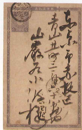
① 明治6年 二つ折葉書の表と中(切手の博物館蔵 大島正昭コレクション) ② 明治29年 巖谷小波宛葉書 ③ 明治44年 黒田湖山差出 巖谷小波宛年賀状 ④ 明治44年 歌川国松差出 巖谷小波宛年賀状

日本最初の児童文学者として知られる巖谷小波は、絵葉書普及に大きな役割を果たした人でもあります。小波は私製絵葉書が解禁になる以前から、仲間達と官製葉書の裏面に絵を描いて送り合っていました。