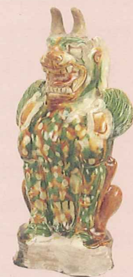
唐三彩鎮墓獸 (学習院大学史料館蔵)