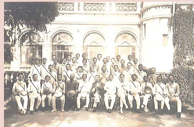
駐北京日本公使館での海外修学旅行団集合写真 大正7年7月28日撮影