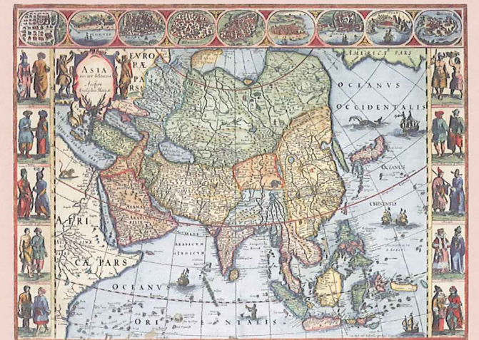
ウィリアム・ブラウ「アジア図」(東洋文庫蔵)

蔵書の内訳は、「東洋」文庫らしく、漢文で書かれた中国関連の書籍が約4割と最多を占めます。その次に多いのが洋書で、約3割を占めています(残りは、約2割が和書、約1割がアジア諸言語となります)。意外に思われるかもしれませんが、東洋文庫のコレクションの粋は、じつは洋書に求められます。