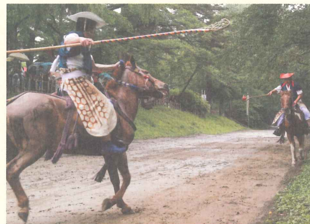
八戸長者山新羅神社