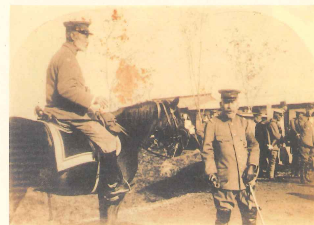
馬に乗った乃木希典(左)と寺内正毅(右)