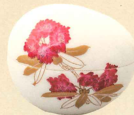
卵形石南花文ボンボニエール 常陸宮華子妃還暦 平成12年 個人蔵

第76回学習院大学史料館講座 「近代の皇室とボンボニエール」 講師：五味 聖氏 (宮内庁三の丸尚蔵館 主任研究官) 日時：5月9日(土) 14:00～15:30 会場：学習院創立百周年記念会館正堂 *入場無料(事前申し込み不要)