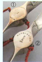
①八稜鏡形梅樹文ボンボニエール [銀製]・北白川宮家紋・北白川宮 永久王御慶事記念品・昭和10年(1935)・径5.0×1.2/59g ②八稜鏡形梅樹文文鎮 [銀製]・北白川宮家紋・径5.0×0.5/88g