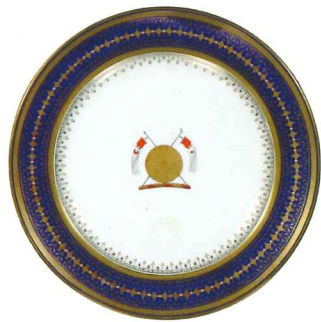
図1 「金彩御旗御紋食皿」ミントン社製 明治8年(1875)〔個人蔵〕

この頃、延遼館で使用されていた国産洋食器は歪みもあり、西洋と同じような製品を作ろうとした職人達の苦心が偲べれます(図3・5)。