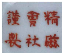
図2 「色絵金彩御旗御紋瑠璃文コーヒー碗・皿」精磁会社製 明治20年(1887)頃〔個人蔵〕