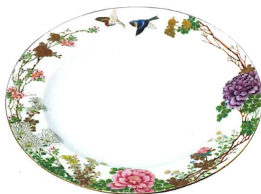
図5 「色絵金彩花鳥文食皿」幹山伝七製 明治6年(1873)～22年 延遼館備品〔個人蔵〕