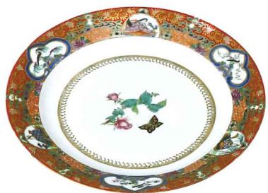
図3 「色絵金彩人物花鳥文食皿」南里嘉壽製 明治5年(1872)～13年 延遼館備品〔個人蔵〕