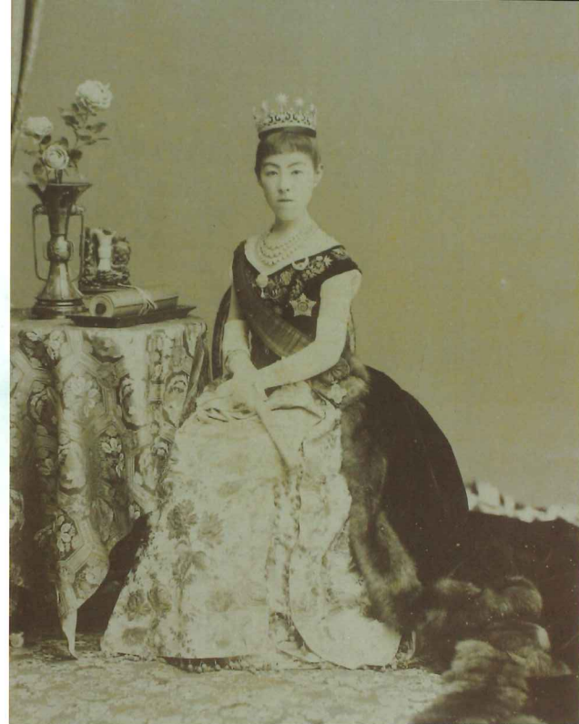
昭憲皇太后 明治22年(1889)6月15日