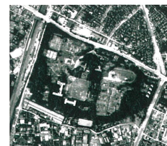
図2 目白学習院付近航空写真 1947年