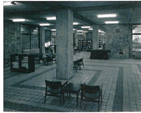
【図1】学習院大学図書館 ひじ付椅子が置かれた1階ロビー 1963年

学習院大学目白キャンパスでは、明治から令和までの時代を映す建造物が存在している。平成21年(2009)に正門、厩舎、乃木館、北別館、東別館、西1号館、南1号館の7棟の建造物が国登録有形文化財に指定され、現在本学では保存活用が認識されるに至っている。