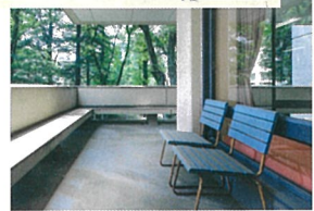
【図5】大学図書館2Fバルコニー 2021年

着いたテイストの調度品に囲まれて重厚感のある雰囲気のある館内から、読書の合間にテラスへ出てこの椅子に座って外の空気を吸い、木々の葉音に耳を傾けることが出来る。