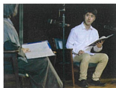
【図3】2021年10月開催の学生による朗読会第6回(声でつむぐ辻文学)「北の唄」でも使用された