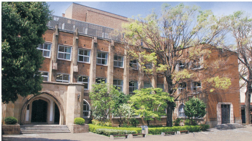
どっしりとした風格を感じさせる西1号館には、多様な建築様式が美しく融合している

キャンパスに遺る数々の馴染み深い場所をご紹介します。このシリーズ。第7回は、国の登録有形文化財にもなっている「西1号館」です。その設計には、世界に目を向けた教育を支えるべく、当時の先端を行く建築知識や技術が惜しみにく注がれました。