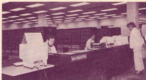
ノースウェスタン大学図書館のカウンター

シカゴで8月17日から24日まで、国際図書館連盟(IFLA)の第51回大会があり、83ヶ国から1460名が参加しました。日本からの参加者は60数名でした。この大会にむけて、日本図書館協会企画のツアーが出ましたので、私もそれに加えてもらっ