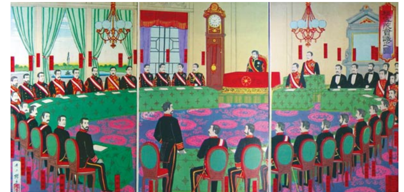
*1) 井上探景画「枢密院会議之図」明治21年刊