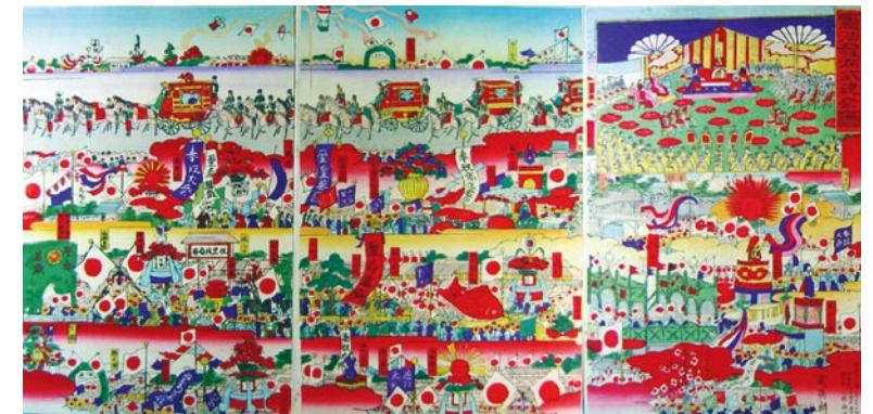
*2) 幾英画「憲法発布式祝祭図」(部分)明治22年刊