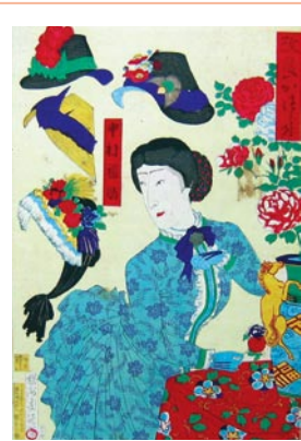
*3) 楊洲周延画「改良かつら付」明治20年刊

以上紹介した6冊の錦絵貼交帳は、明治期の日本の様子を伝える歴史的資料としても、当時の浮世絵師達の活躍状況や画風変遷を知らせる美術史的資料としても大変貴重なものである。