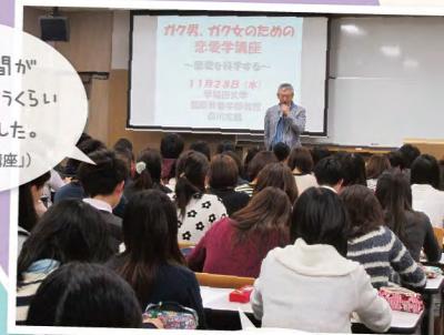
普段の授業では全く扱わない題材の講演を聞いて良かったです。(2014春「てっ!」えいえいえい!方言)