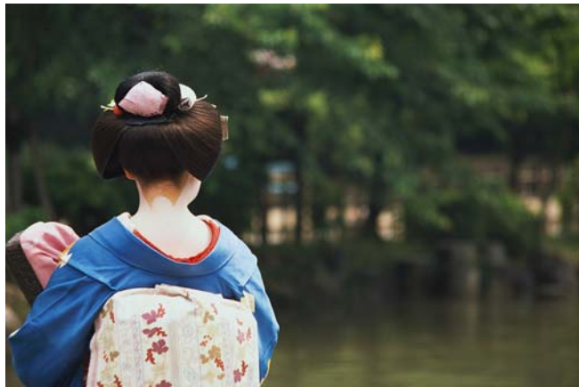
平成 19 年 6 月 - 7 月 1F 展示 学習院大学図書館