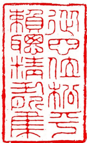
<従四位松平頼聡精力所集>

華族会館寄贈資料の中でもっとも大部を占めるのが、この「高松松平家旧蔵本」である。これらは高松藩最後の藩主松平頼聡の旧蔵書と見られ、33部2,737冊という蔵書数であり、さらに資料の質も非常に高いとされる。ただ、これらの資料がどのような経緯で華族会館に渡ったかは不明である。当館所蔵の松平旧蔵書には、例外なく「従四位松平頼聡精力所集」という蔵書印が押印されている。また、同じく蔵書印として、高松松平家の別邸である「披雲閣」からとった「披雲閣」「披雲閣蔵書」「披雲閣蔵書記」「講道館」などが押印されており、高松藩の旧蔵書がベースになっているとされる。今回展示している資料は、当館が所蔵する松平旧蔵本の一部である。