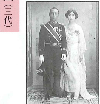
武彦王・佐紀子妃