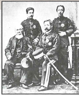
晃親王と弟宮方 左より 晃親王、 北白川宮能久親王、 小松宮彰仁親王、 伏見宮貞愛親王

伏見宮 邦家親王 光格天皇猶子 享和2・8・10・2724生 天保13・8・10・2724生 落飾 守脩親王 光格天皇養子 堀井門跡 梨本宮(初代)